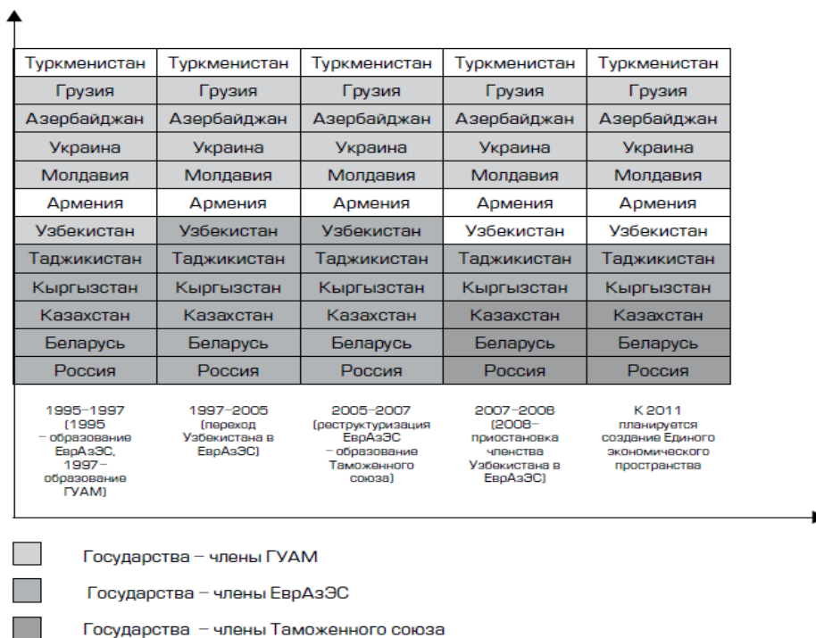
Рисунок 3 — Динамика институциональных преобразований региональных интеграционных формирований в СНГ