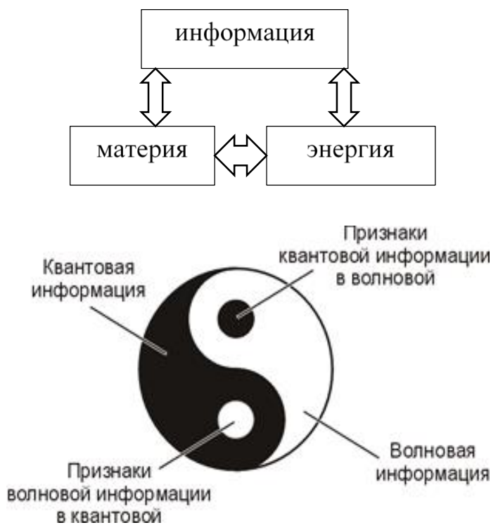
Рис. 4. Триединство энергии, материи и информации в символе Тай Ци [ http://monada-edinenie.ru/node/25 ]

Все природные явления представляют собой динамическое взаимодействие между энергией, материей и информацией. Согласно современным данным, эти три категории представляют собой непрерывное единство – континуум. Интерпретация Дао в терминах энергии, материи и информации привела к появлению новой трактовки символа монады Тай Ци (рис. 4).