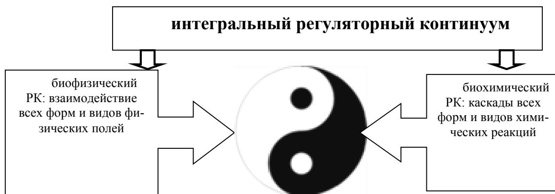
Рис. 5. Великий предел Тай Цзи и интегральный регуляторный континуум (PK).

явлений в общей картине мира. Только при этих условиях стали возможными и приспособление живого к внешним событиям, и прогресс его материальной организации”. Он же представлял химический континуум мозга как механизм отражения действительности [19]. Дальнейшие исследования И.П. Ашмарина и его школы показали, что биохимический континуум, представленный широким спектром регуляторных пептидов, классическими нейромедиаторами, гормонами, цитокинами и ростовыми факторами различной химической природы играют исключительно важную роль во всех регуляторных процессах организма [20].